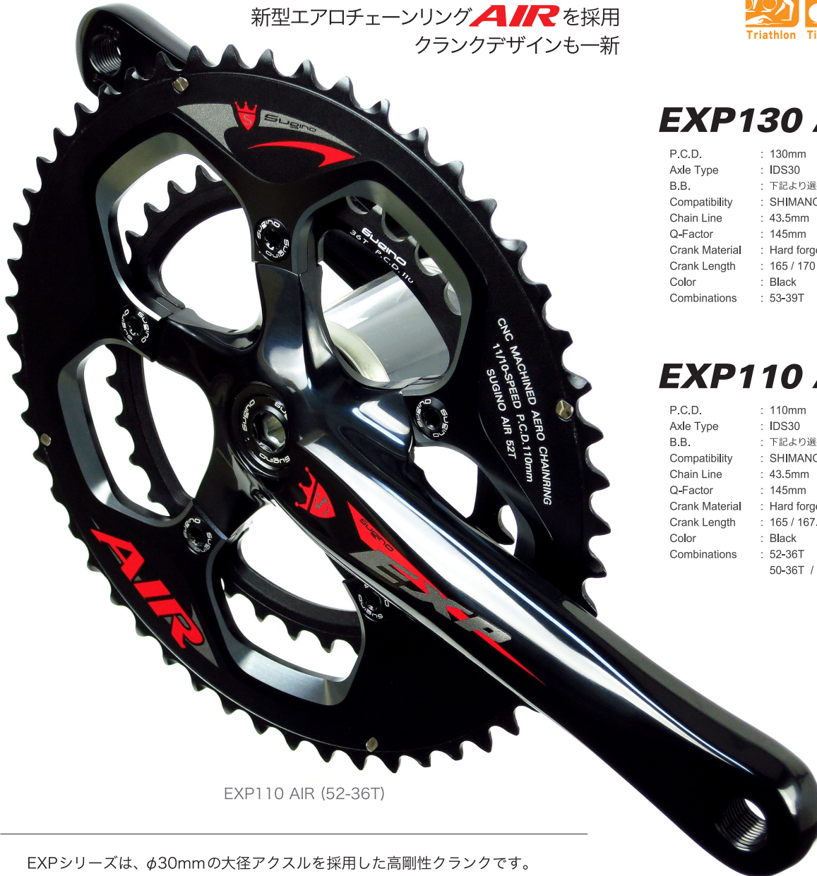
EXP110 AIR (52-36T)