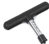
TL-Peg nut wrench